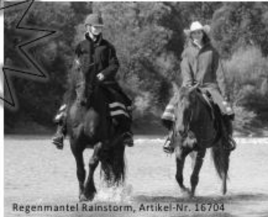
Regenmantel Rainstorm, Artikel-Nr. 16704

sattelkammer.ch Reitsport GmbH Hauptstrasse 13 8259 Rheinklingen 052 740 34 36 info@sattelkammer.ch